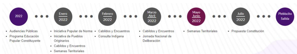
Ilustración 1. Proceso participativo de la Convención Constitucional de Chile