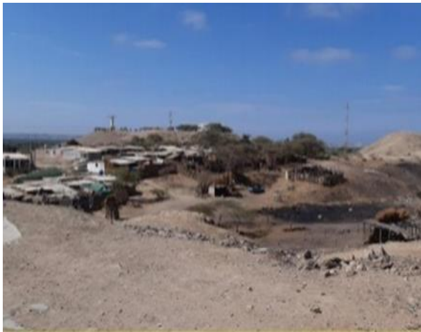
Figura 4. Relaciones sociales en tensión en la producción de carbón de espino.

Finalmente, un elemento que está ligado al tema de los lazos sociales es la manera cómo los individuos se relacionan entre sí en el territorio. Esto, entendido como la necesidad de mejorar el trato en la convivencia ciudadana, en el cotidiano, lo cual responde a una demanda por una mayor igualdad en el lazo social y el reconocimiento de las diferencias en igualdad de condiciones. El trato no aparece de manera directa en el discurso de los entrevistados, es un elemento que cruza sus discursos cuando se refieren a las faltas de respeto que reciben cuando asisten a los servicios de salud, al tomar el transporte público, cuando los reciben en el municipio. Son los desequilibrios en las relaciones sociales que muestran diferencias de estatus, que rompen un ideal de igualdad que, aunque abstracto, está presente en la idea de un bienestar común para el territorio.