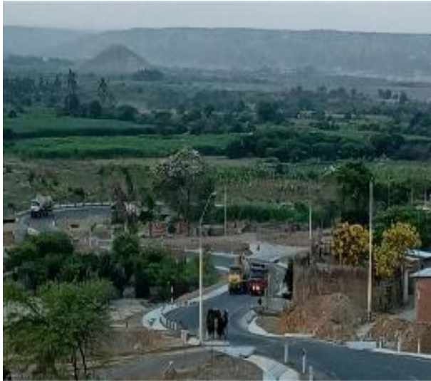
Figura 1. Desarrollo en infraestructura y conectividad y sus impactos en la calidad de vida.

territorio del Bajo Chira que, sin embargo, adolece de un elemento importante para la autora del fotovoz: en su proyección y ejecución no incorporó un espacio o demarcación para la presencia de ciclistas.