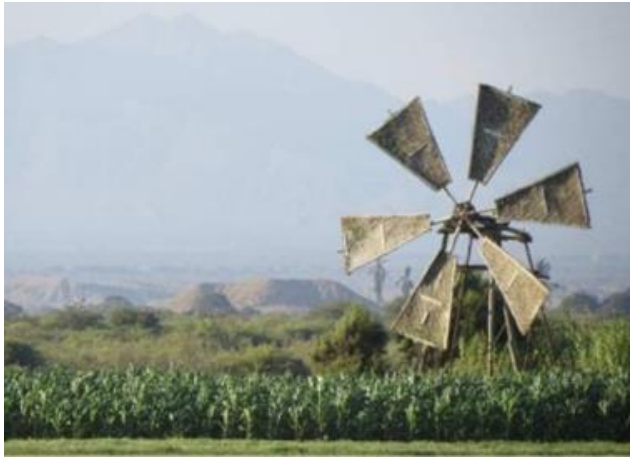
Figura 5. Orgullo de las tradiciones locales

orgullo y admiración por los molinos de viento, parte de la identidad del territorio, muy asociada al cultivo y producción de la tierra. Los molinos son el reflejo de varios puntos que ella asocia al aprovechamiento del agua, a la capacidad de innovar y mantener prácticas tradicionales que hacen del territorio un espacio rico en cultura, lo que permite generar un balance positivo entre conservación y cambio, tradiciones e innovación.