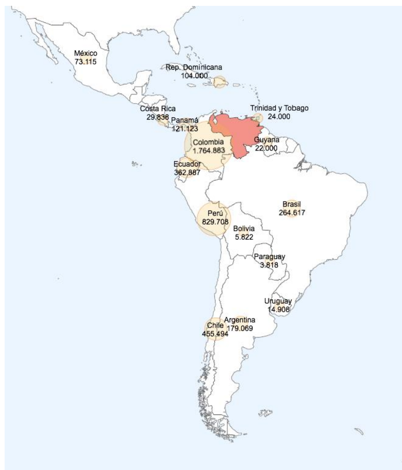
Figura 1. Distribución de la migración venezolana en América Latina

De acuerdo a los datos oficiales, del total de migrantes venezolanos, la mayor parte se concentra en Colombia (1.7 millones) y Perú (829 mil), seguidos por Chile (455 mil) y Ecuador (362 mil), como se observa en la figura 1.