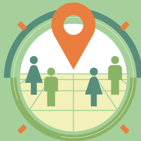
Territorios e Inclusión