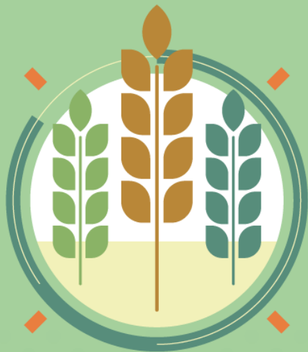
Sistemas Agroalimentarios Sostenibles