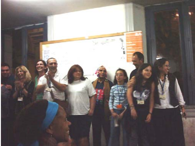
Organizadores - Cierre