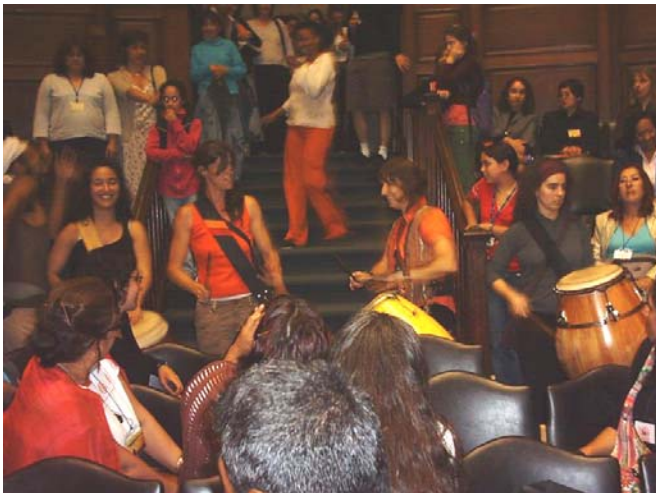
Conversatorio con Pueblos Indígenas